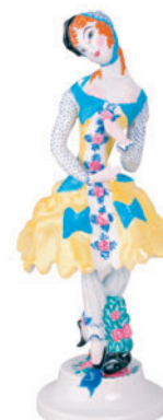
Скульптура Коломбина Автор О. Глебова-Судейкина H-255 мм 82.04879