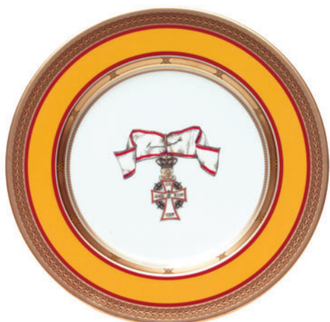
Тарелка декоративная, форма Mazarin, рисунок Орден Даннеброг D-265 мм 81.18066