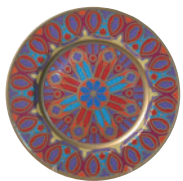
Тарелка декоративная форма Mazarin рисунок Готические витражи 81.19625