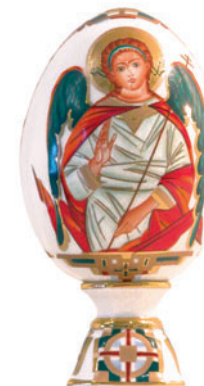
Яйцо пасхальное Ангел-Хранитель Автор Т. Чарина H-132 мм 80.07587