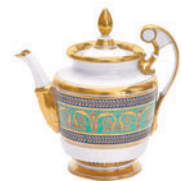
Чайник форма Александрия рисунок Золотой 800 мл