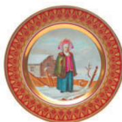
Тарелка декоративная форма Mazarin рисунок Калужская купчиха D-265 мм 81.18062