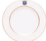
Тарелка мелкая форма Европейская рисунок Коттеджный D-265 мм