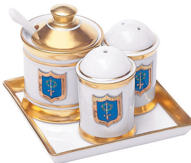
Набор для специй, форма Орега, рисунок Коттеджный 81.16080

Сервиз, созданный в «готическом вкусе», как и все оформление дворца, органично вписался в интерьер, отличавшийся редким стилистическим единством отделки и художественного убранства, изысканностью и утонченностью. Все предметы сервиза украшены гербом Александрии, составленным поэтом В.А. Жуковским.