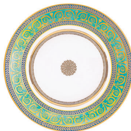
Блюдо круглое, форма Mazarin, рисунок Золотой D-320 мм 80.65357

Сервиз «Гербовый» («Золотой») был создан на Императорском фарфоровом заводе в 1827 году по заказу Николая I, для Павловского дворца, резиденции матери Императора, Императрицы Марии Федоровны (жены Павла I). Сервиз состоял из 240 тарелок и 48 овальных блюд с изображением герба Николая I в центре каждого изделия. В росписи произведения использованы синие и зеленые классические тона, с нанесенным на них изысканным растительным и геометрическим орнаментом. Изобилие золота в росписи дало сервизу второе имя – «Золотой».