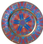
Тарелка декоративная форма Mazarin рисунок Готические витражи 81.19621