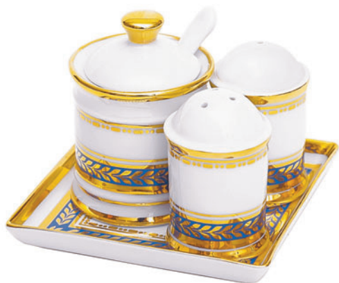
Набор специй форма Орега, рисунок Золотой Подставка для специй 81.20864