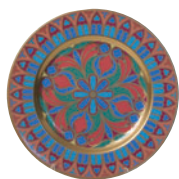
Тарелка декоративная форма Mazarin рисунок Готические витражи 81.19624

Надглазурное полихромное декорирование Золочение