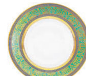
Тарелка мелкая форма Европейская рисунок Золотой D-300 мм