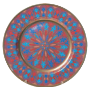
Тарелка декоративная форма Mazarin рисунок Готические витражи 81.19254