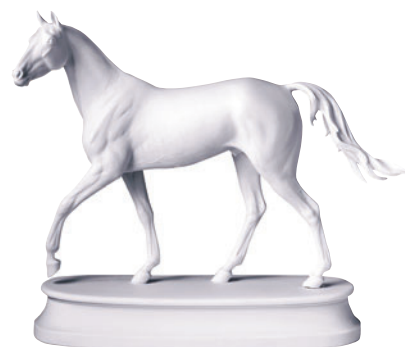
Скульптура Конь Ахалтекинский Белый H-198 мм 81.18627