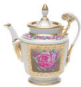
Чайник форма Александрия рисунок Воспоминание 800 мл

Сервиз чайный 6/20 81.17898.00.1 Сервиз кофейный 6/21 81.17899.00.1 Сервиз столовый 6/24 81.20858.00.1 3-предметный комплект чайный 81.20859.00.1 3-предметный комплект кофейный 81.20860.00.1