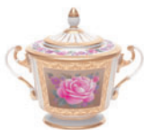
Сахарница форма Александрия рисунок Воспоминание 500 мл