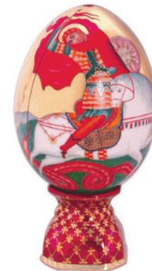
Яйцо пасхальное Святой Георгий и дракон Автор Г. Шуляк H-132 мм 80.09219