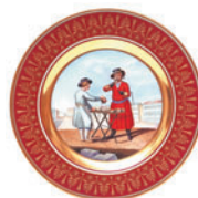
Тарелка декоративная форма Mazarin рисунок Продавец киселя и кучер D-265 мм 81.18058