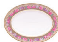
Блюдо овальное форма Европейская рисунок Воспоминание D-360 мм