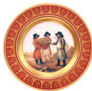
Тарелка декоративная форма Mazarin рисунок Уличные торговцы D-265 мм 81.18060