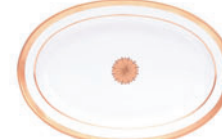
Блюдо овальное форма Молодежная рисунок Коттеджный D-350 мм