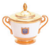
Сахарница форма Александрия рисунок Коттеджный 500 мл