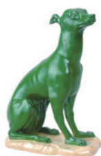
Скульптура Левретка Автор Ж.Д. Рашет H-160 мм 82.01233

Ручная отливка Ручная надглазурная роспись Золото, цирровка