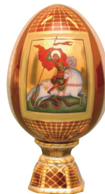
по заказу Яйцо пасхальное Георгий Победоносец Автор Г. Шуляк H-146 мм 80.05875