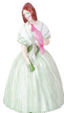
Скульптура Дама с попугаем Автор В. Кузнецов H-203 мм 82.00311