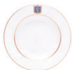
Тарелка глубокая форма Европейская рисунок Коттеджный D-225 мм