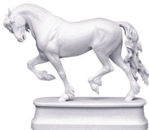
Скульптура Конь Фризской породы Белый H-187 мм 81.18591