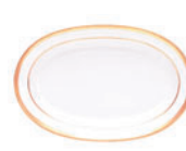
Блюдо овальное форма Молодежная рисунок Коттеджный D-280 мм