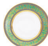
Тарелка мелкая форма Европейская рисунок Золотой D-265 мм