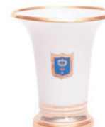
Ваза форма Ампириная рисунок Коттеджный H–203 мм 80.52458