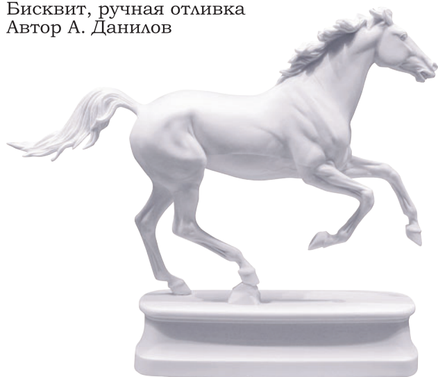
Скульптура Конь Англо-арабский Белый H-200 мм 81.18629

Бисквит, ручная отливка Автор А. Данилов