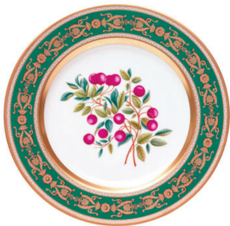
Тарелка декоративная, форма Европейская, рисунок Брусника D-265 мм 81.18050