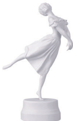
Скульптура Тамара Карсавина Автор С. Судьбинин H-300 мм 82.01714