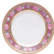
Тарелка мелкая форма Европейская рисунок Воспоминание D-265 мм