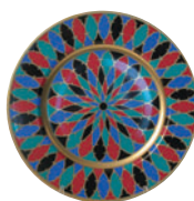
Тарелка декоративная форма Mazarin рисунок Готические витражи 81.19255