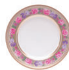
Тарелка мелкая форма Европейская рисунок Воспоминание D-220 мм