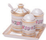
Набор для специй форма Орега рисунок Воспоминание 81.17425