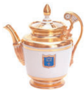
Чайник форма Александрия рисунок Коттеджный 800 мл