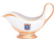
Соусник форма Александрия рисунок Коттеджный 200 гр 80.52444