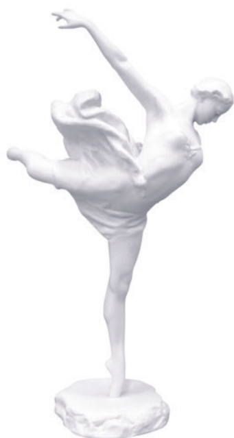
Скульптура Галина Уланова Автор Е. Янсон-Манизер H-392 мм 82.09373