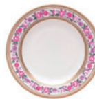
Тарелка мелкая форма Европейская рисунок Воспоминание D-190 мм