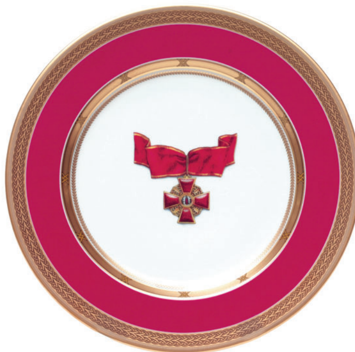
Тарелка декоративная, форма Mazarin, рисунок Орден Святой Анны D-265 мм 81.18065

Ручная надглазурная роспись Золото, цировка