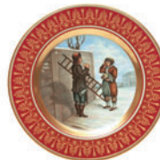
Тарелка декоративная форма Mazarin рисунок Фонарщик D-265 мм 81.18063