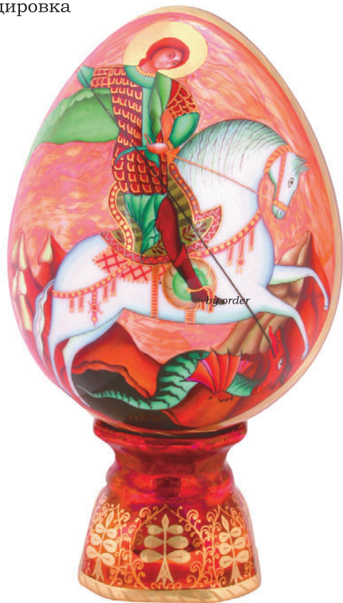
Яйцо пасхальное Битва Святого Георгия Автор Г. Шуляк H-155 мм 80.05877

Ручная надглазурная роспись Золото, цировка