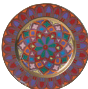
Тарелка декоративная форма Mazarin рисунок Готические витражи 81.19622