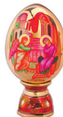
Яйцо пасхальное Благовещение Автор Г. Шуляк H-146 мм 80.03257