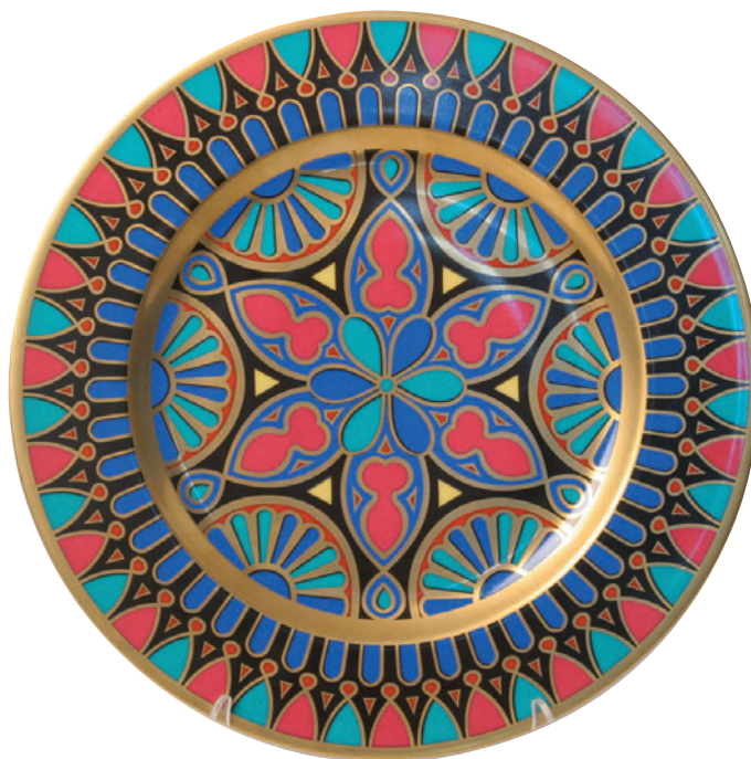
Тарелка декоративная форма Mazarin рисунок Готические витражи 81.19256