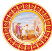
Тарелка декоративная форма Mazarin рисунок Игра в свайку D-265 мм 81.19338