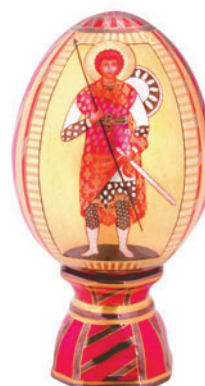
Яйцо пасхальное Святой Георгий (иконка) Автор Г. Шуляк H-146 мм 81.05871