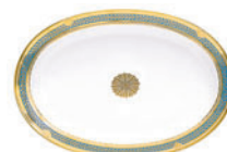
Блюдо овальное форма Молодежная рисунок Золотой D-350 мм