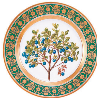
Тарелка декоративная, форма Европейская, рисунок Черника D-265 мм 81.18048