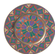
Тарелка декоративная форма Mazarin рисунок Готические витражи 81.19623