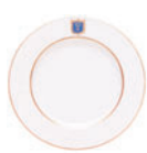
Тарелка мелкая форма Европейская рисунок Коттеджный D-220 мм