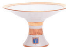
Ваза для фруктов форма Молодежная рисунок Коттеджный H–155 мм 80.52446