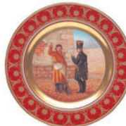
Тарелка декоративная форма Mazarin рисунок Дворник и военный D-265 мм 81.18057