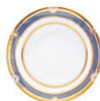
Тарелка глубокая форма Европейская рисунок Золотой D-225 мм