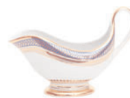
Соусник форма Александрия рисунок Золотой 200 гр