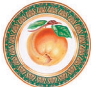
Тарелка декоративная форма Европейская рисунок Балтиморское яблоко D-265 мм 81.18047