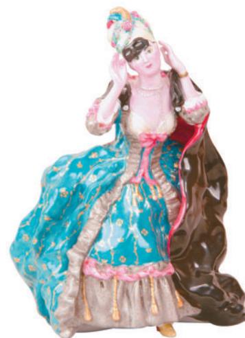
Скульптура Дама с маской Автор К. Сомов H-216 мм 82.53431