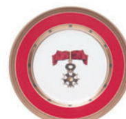
Тарелка декоративная форма Mazarin рисунок Орден Почетного легиона D-265 мм 81.18067