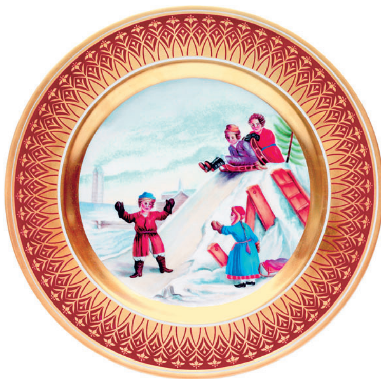
Тарелка декоративная, форма Mazarin, рисунок Зимние горы D-265 мм 81.18064

Ручная надглазурная роспись Тонированная позолота, цифровка