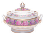
Супница форма Александрия рисунок Воспоминание 3000 мл 80.58168