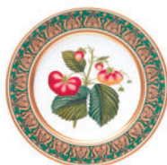
Тарелка декоративная форма Европейская рисунок Клубника D-265 мм 81.18049