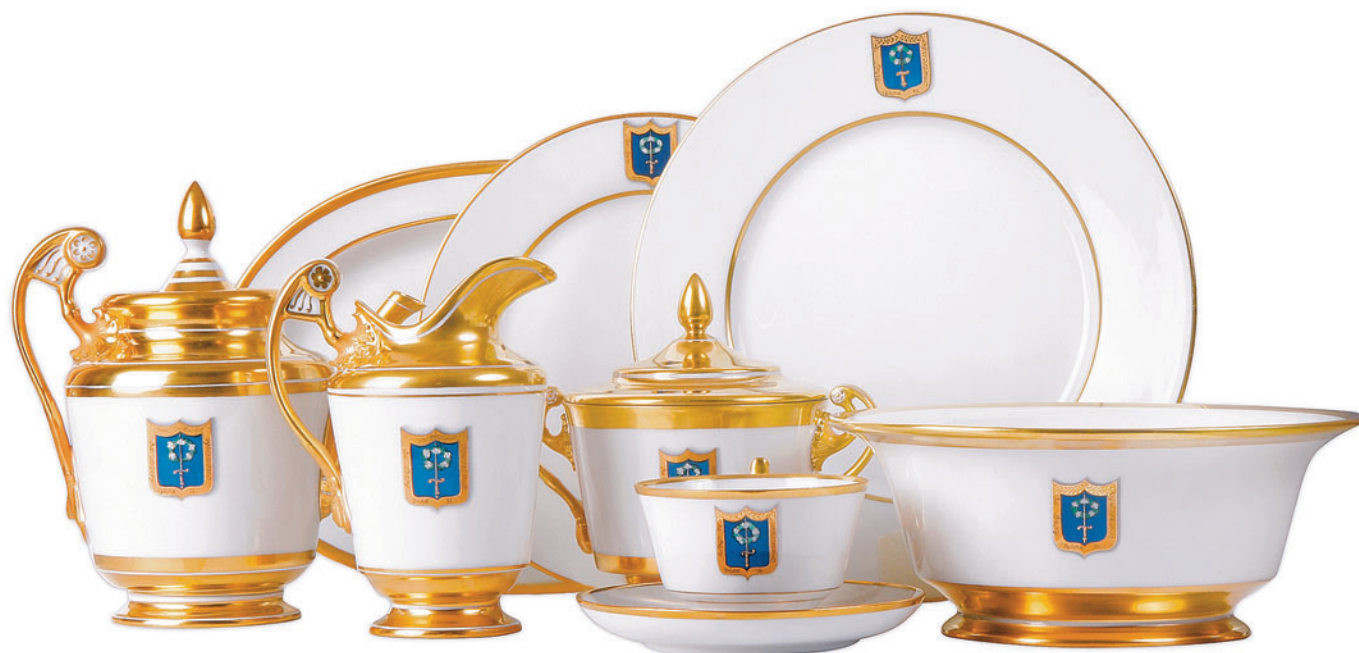
Сервиз чайный 6/20 81.20867.00.1 Сервиз столовый 6/24 81.20868.00.1 3-предметный комплект чайный 81.20869.00.1

Ручная отливка Ручная надглазурная роспись Золото