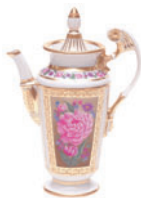
Кофейник форма Александрия рисунок Воспоминание 670 мл