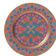
Тарелка декоративная форма Mazarin рисунок Готические витражи 81.19258