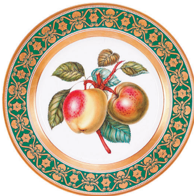
Тарелка декоративная, форма Европейская, рисунок Два яблока D-265 мм 81.18051

Ручная надглазурная роспись Тонированная позолота, цировка