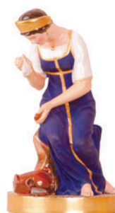
Скульптура Девушка с разбитым кувшином Автор С. Пименов H-225 мм 82.04669