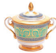
Сахарница форма Александрия рисунок Золотой 500 мл