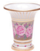
Ваза форма Ампириная рисунок Воспоминание H-203 мм 80.58194