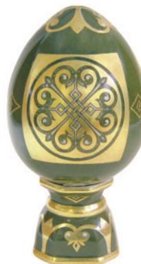
по заказу Яйцо пасхальное Византийское Автор Т. Чарина H-140 мм 80.01719