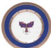
Тарелка декоративная форма Mazarin рисунок Викторианский Орден D-265 мм 81.18068