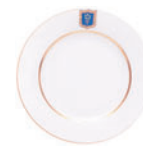
Тарелка мелкая форма Европейская рисунок Коттеджный D-190 мм