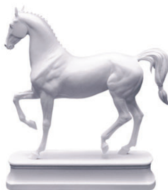
Скульптура Липициан Белый H-192 мм 81.18630