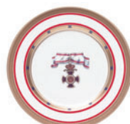
Тарелка декоративная форма Mazarin рисунок Орден Даниила D-265 мм 81.18069