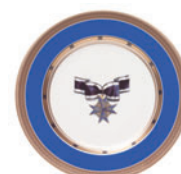
Тарелка декоративная форма Mazarin рисунок Орден «За заслуги» D-265 мм 81.18070