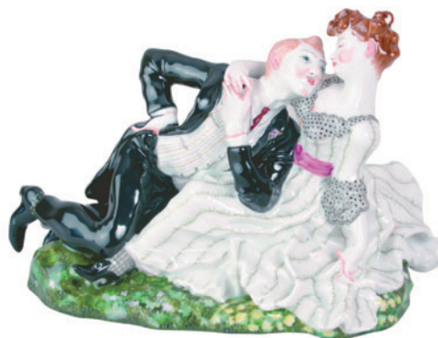
Скульптура Влюбленные Автор К. Сомов H-137 мм 82.08358