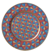
Тарелка декоративная форма Mazarin рисунок Готические витражи 81.19253