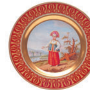
Тарелка декоративная форма Mazarin рисунок Купчиха D-265 мм 81.18061