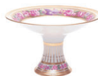
Ваза для фруктов форма Молодежная рисунок Воспоминание H-155 мм 80.58180