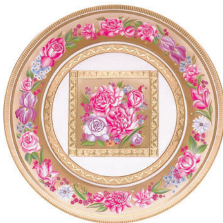
Блюдо круглое, форма Mazarin, рисунок Воспоминание D-320 мм

Форма «Александрия» была впервые создана на Императорском фарфоровом заводе в начале XIX века, специально для Петергофского дворца «Коттедж», построенного архитектором А. Менеласом в неоготическом стиле для супруги Николая I – Императрицы Александры Федоровны. Автор росписи, художник С. Богданова, создала на поверхности знаменитой формы изысканный и нарядный рисунок. На предметах сервиза расположились пышные цветочные букеты, фризы и отдельные георгины и розы, заключенные в прямоугольные медальоны и оформленные богатым золотым декором. Классическое композиционное построение гармонично сочетается со старинной формой, преобладание в росписи пурпура и золота придает сервизу праздничный торжественный облик. По золотому орнаменту нанесен филигранный рисунок полудрагоценным агатом.