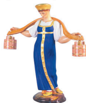
Скульптура Водоноска Автор С. Пименов H-260 мм 82.50199