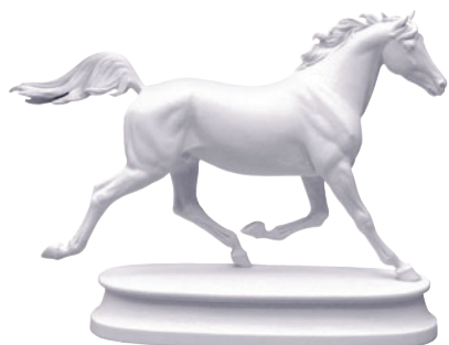
Скульптура Конь Арабской породы Белый H-173 мм 81.18628