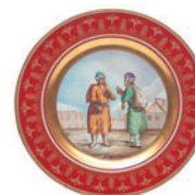
Тарелка декоративная форма Mazarin рисунок Торговец икрой D-265 мм 81.18059