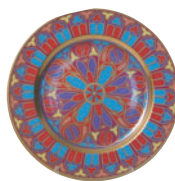
Тарелка декоративная форма Mazarin рисунок Готические витражи 81.19626